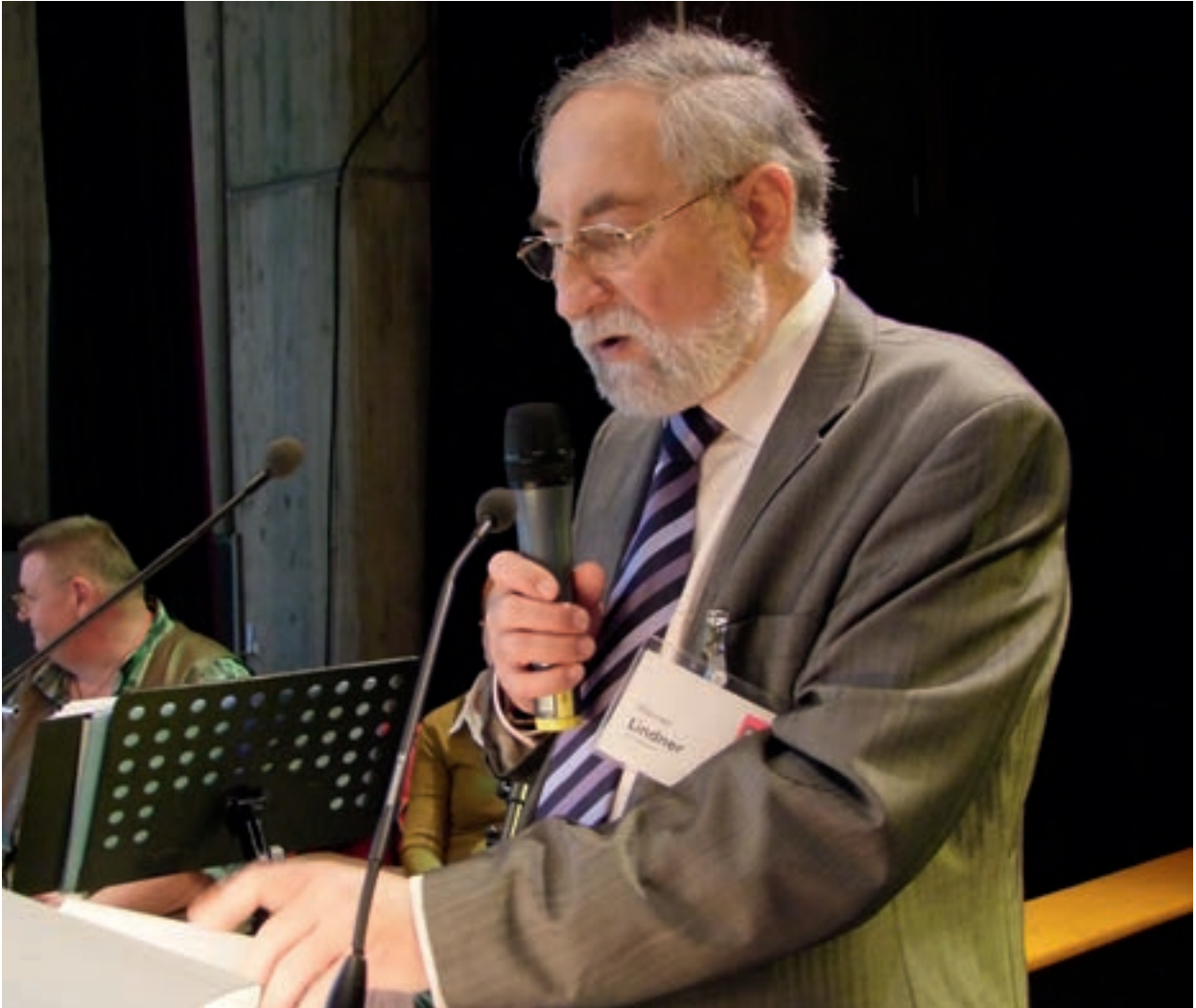
30-Jahr-Feier im Oktober 2010

muss. Ich werde meinem Nachfolger sicher nicht reinreden. Freilich möchte ich mich auch nach meinem Abschied weiter mit den Mitarbeiterinnen und Mitarbeitern unterhalten können ohne dass dies misstrauisch beobachtet wird. Und so ganz lasse ich ja auch nicht los, mein Sohn arbeitet ja weiter hier und ich kann mir auch vorstellen, im Förderverein aktiv zu werden. Die WfB wird also nicht ganz aus meinem Leben verschwinden. Ich bin zwar draußen, aber nicht außen vor. Er lacht.